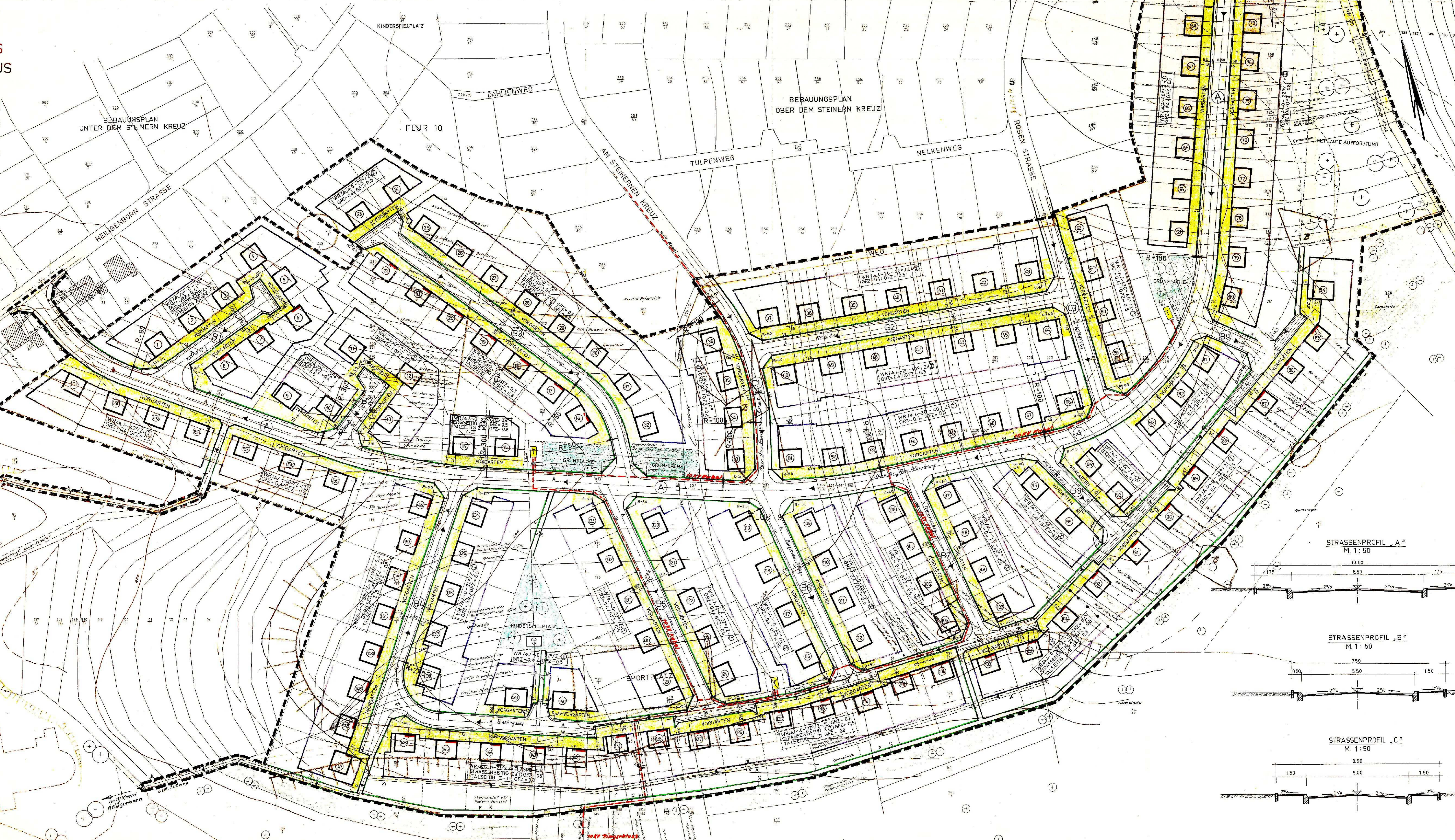
STRASSENPROFIL „A“ M. 1: 50