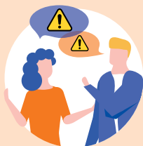
Familien- und Freundeskreis, Nachbarschaft